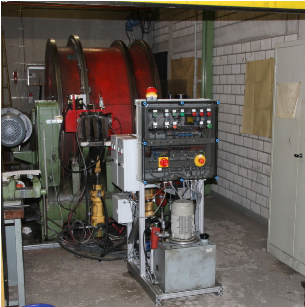
Der Überrollprüfstand an der Universität in Bochum, wo die Idee für die Realisierung des Kuppelverschiebe-Mechanismus auf Herz und Nieren geprüft wurde. Ergebnis: Das wird funktionieren und zwar wartungsfrei über die gesamte Lebensdauer des Moscheedachs.